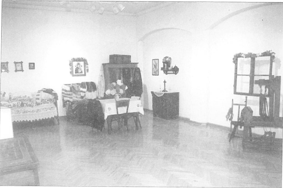
Ilustr. 1. Fragment ekspozycji czasowej „Zapomniana Atlantyda. Świat Łemków, Bukowińców i Hucułów”, 2002/2003