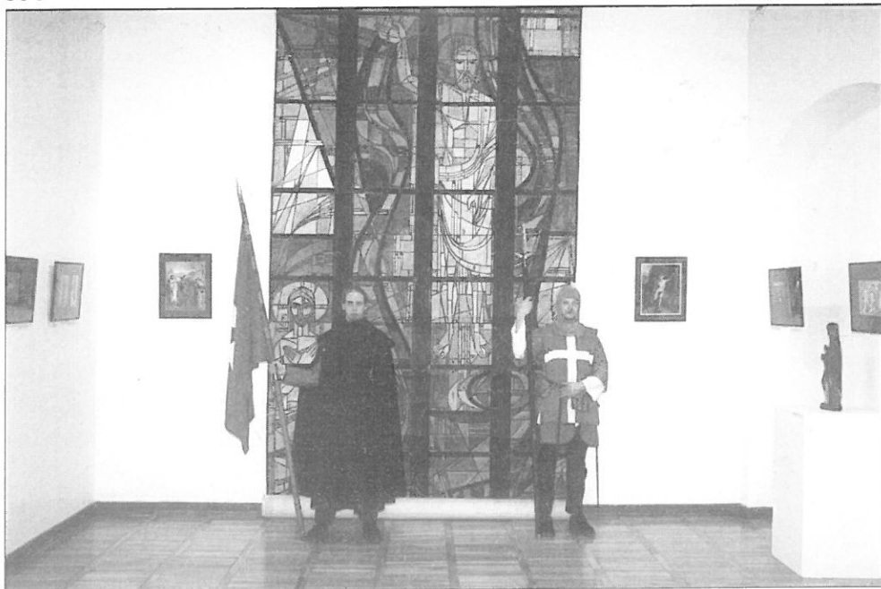
Ilustr. 3. Fragment ekspozycji czasowej „Święty Jan Chrzciciel w sztuce. Rzeźba – malarstwo – grafika” oraz członkowie Bractwa Rycerzy św. Jana w Stargardzie, 27.05.2003 – 31.08.2003