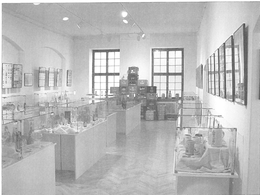
Ilustr. 4. Fragment ekspozycji czasowej „Tyle było tych piw...”, 31.07.2003 – 30.09.2003